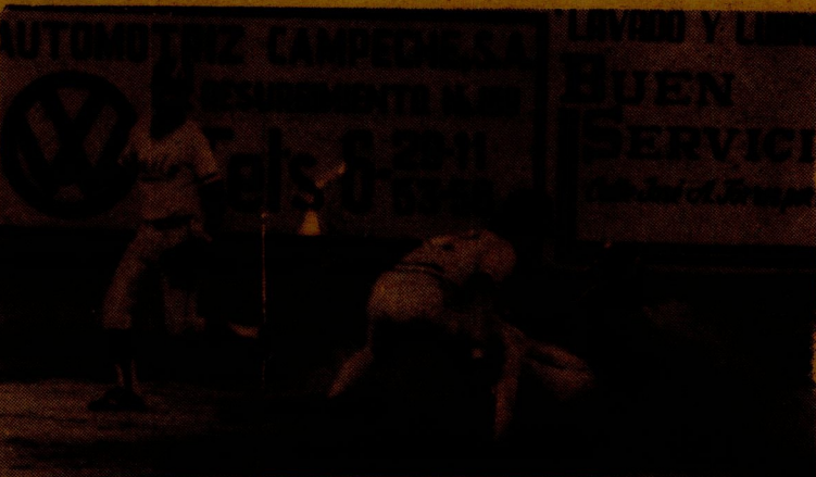
Ossie Olivares, es puesto fuera en intento de robo en segunda base, en la quinta entrada, del juego de anoche entre Piratas y Aguilas de Veracruz. (Foto Manuel Opengo).