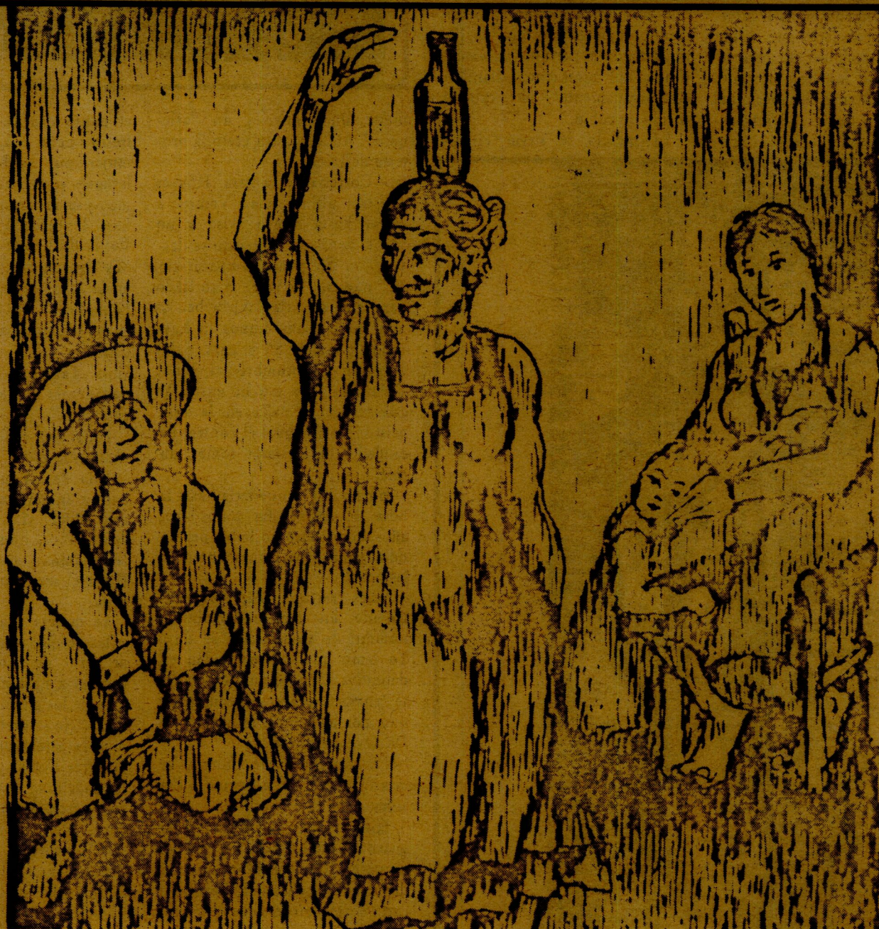
Ilustración tomada de Extensión 25, septiembre-diciembre 1987.