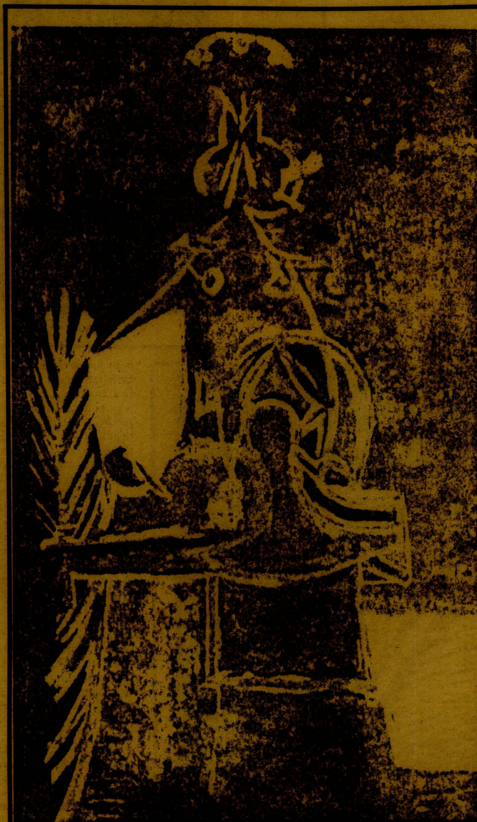
Ilustración de Juan Soriano, tomada de Universidad de México, septiembre 1987, Vol. XLII, Núm. 440.

Ola de amor que bañas mi cuerpo movimiento tras movimiento, heme aquí aprisionado por barrotes invisibles que el corazón me construye: con su bombeo insistente, con su temblor en caricia, con su poema de forma; para tratar de evitar que mi cuerpo no sienta a otro que no sea el tuyo. ¡Por favor! detente un sol, si quieres una luna, para vivir la libertad del común y terrestre animal. ¿No sabes, acaso, que soy mortal? ¿No ves, siquiera, que mi barro lavado está? Debes de aprenderle algo a este mar inmóvil y darme en su espejo el rostro de tu pasividad porque ya mi vida se duele de toda tu inquietud.