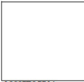
LOGOTIPO DE LA AGRUPACIÓN POLÍTICA

CONTROL DE PAGOS REALIZADOS POR EL COMITÉ _____ (2)