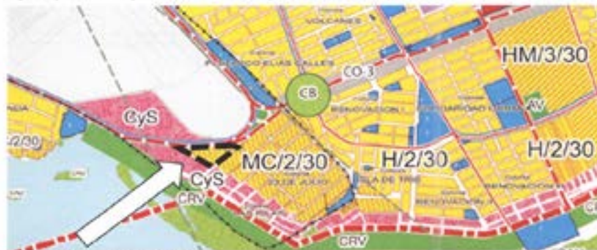
Figura 2. Predio en PDU vigente

Acceso vial: Su principal acceso urbano es por la carretera 180, una vía Federal con cuatro carriles de circulación (dos para cada dirección: Villahermosa - Campeche y viceversa), con carpeta asfáltica, en donde se genera una de las mayores afluencias de vehículos motorizados en la ciudad. Y en donde la empresa deberá hacer las adecuaciones necesarias para asegurar el ingreso y salida a la gasolinera de forma segura para peatones y vehículos.