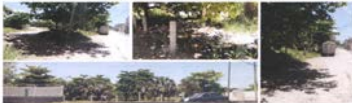
Figura 5. Imágenes actuales de predio baldío y su entorno

El proyecto consiste en la construcción de una Estación de Servicio Tipo Urbana, que contará con área de facturación, contabilidad, operativos, área de corte, sanitarios clientes, sanitarios empleados, cuarto de empleados, bodega, cuarto de control eléctrico, cuarto de limpios, cuarto de sucios, cuarto de máquinas, áreas verdes, tienda de conveniencia, área de tanques de almacenamiento, estacionamiento y área de servicio con seis dispensarios 3 dispensarios con doble producto (Magna - Premium) y 1 dispensario con 1 producto (Diésel) para abastecer a 8 vehículos simultáneamente. La ubicación de los módulos de servicios se localizará en la parte central del predio inmediato a la vía de acceso a la Estación de Servicio. (figura 6)