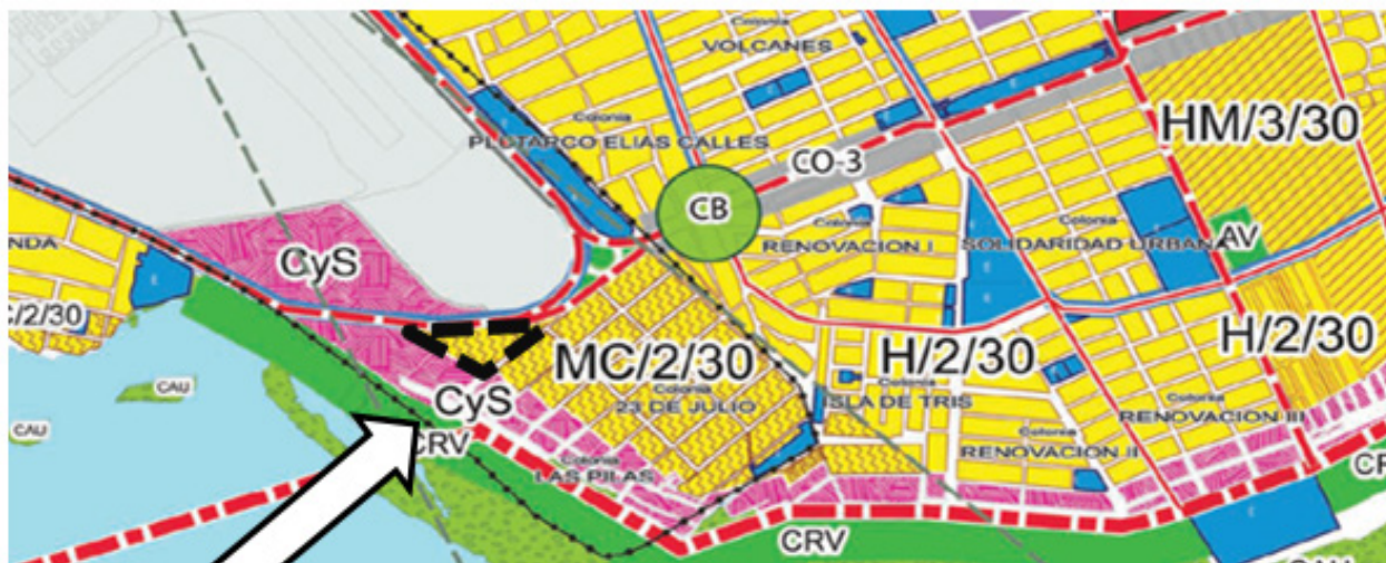
Figura 2. Plano en PDU vigente

Acceso vial. Su principal acceso urbano es por la carretera 180, una vía Federal con cuatro carriles de circulación (dos para cada dirección; Villahermosa - Campeche y viceversa), con carpeta asfáltica, en donde se genera una de las mayores afluencias de vehículos motorizados en la ciudad. Y en donde la empresa deberá hacer las adecuaciones necesarias para asegurar el ingreso y salida a la gasolinera de forma segura para peatones y vehículos.