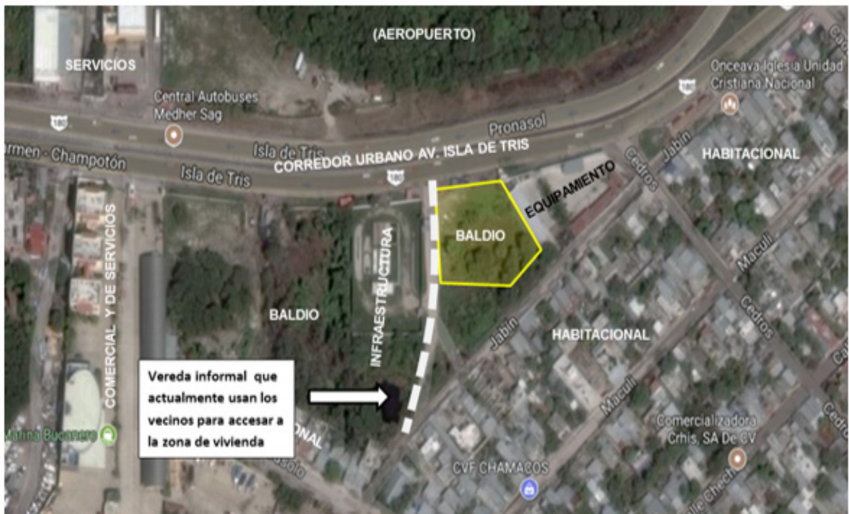
Figura 4. Foto aérea de la zona y sus usos de suelo