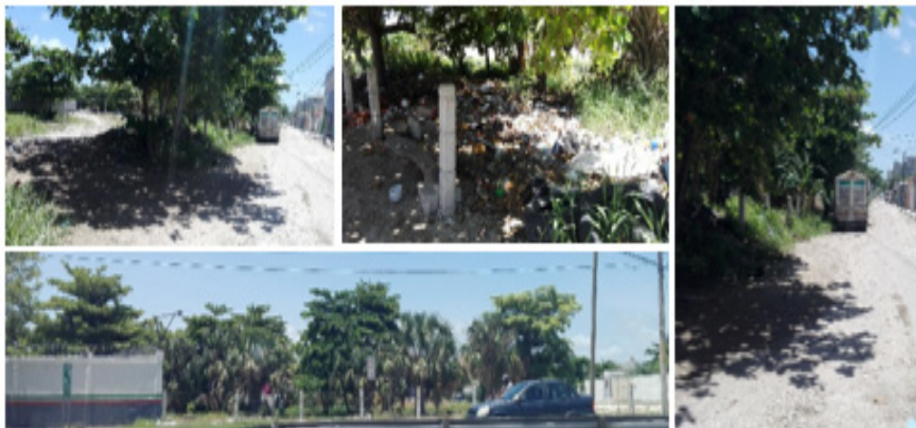
Figura 5. Imágenes actuales de predio baldío y su entorno

El proyecto consiste en la construcción de una Estación de Servicio Tipo Urbana, que contará con área de facturación, contabilidad, operativos, área de corte, sanitarios clientes, sanitarios empleados, cuarto de empleados, bodega, cuarto de control eléctrico, cuarto de limpios, cuarto de sucios, cuarto de máquinas, áreas verdes, tienda de conveniencia, área de tanques de almacenamiento, estacionamiento y área de servicio con seis dispensarios 3 dispensarios con doble producto (Magna - Premium) y 1 dispensario con 1 producto (Diésel) para abastecer a 8 vehículos simultáneamente. La ubicación de los módulos de servicios se localizará en la parte central del predio inmediato a la vía de acceso a la Estación de Servicio. (Figura 6).