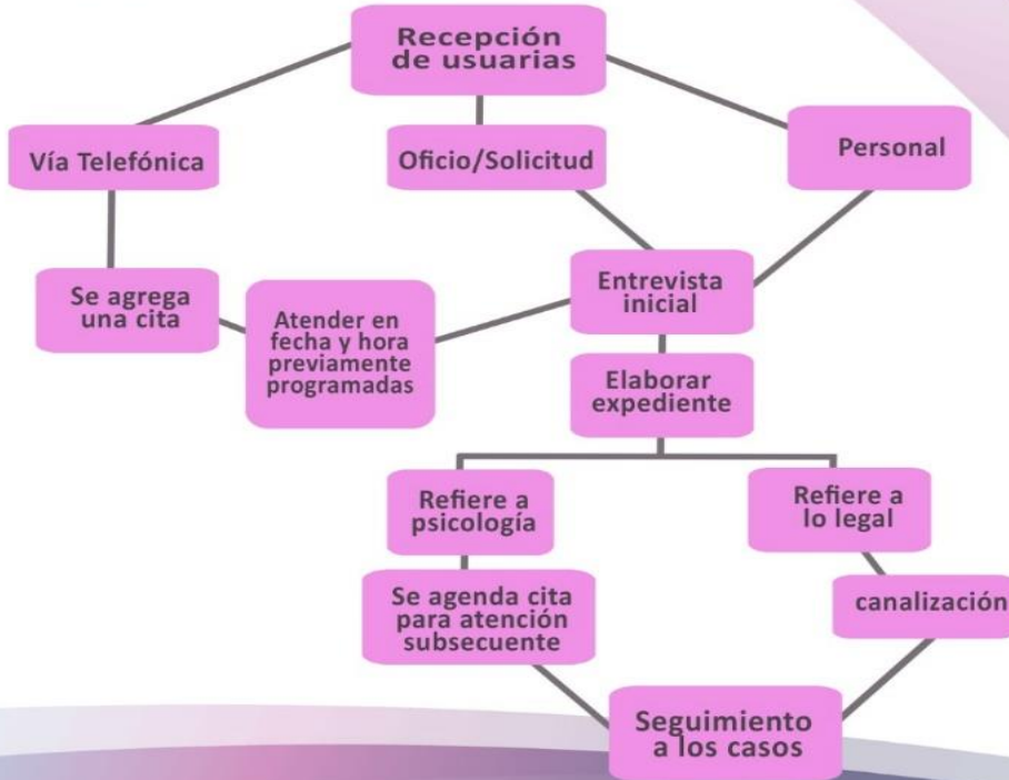
Diagrama de flujo-Atención social

INSTANCIA MUNICIPAL DE LA MUJER CHAMPOTÓN.