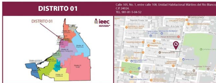
Anexo 1 Hoja 2/2