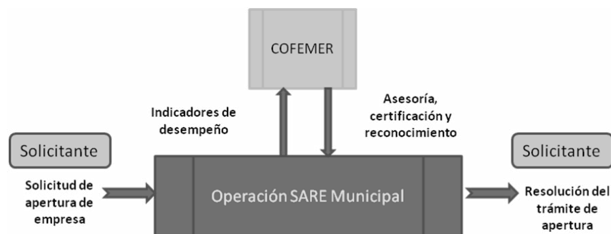
Cuadro 1. Planificación de la Prestación del Servicio