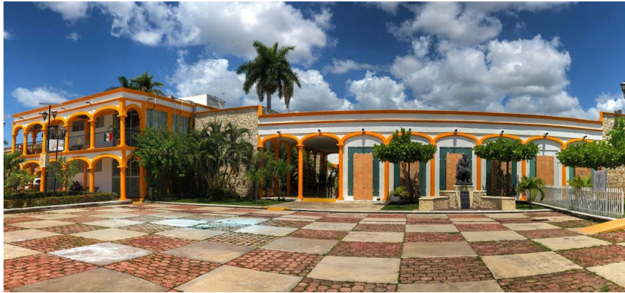
Casa de Justicia, San Francisco de Campeche, Sede del Poder Judicial del Estado de Campeche, Primer Distrito Judicial.

Del artículo 223 de la Ley Orgánica del Poder Judicial del Estado se advierte que las y los funcionarios y empleadas y empleados del Poder Judicial deberán observar una conducta decorosa, tanto en el desempeño de su cargo o función, como fuera de él, así como ajustar su conducta a las disposiciones del Código de Ética del Poder Judicial.