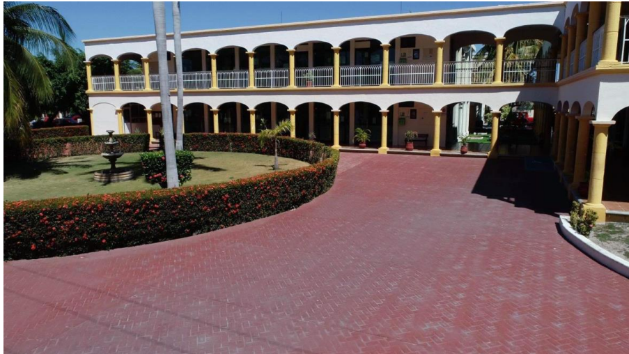
Casa de Justicia. Ciudad del Carmen, Campeche. Sede del Poder Judicial del Estado de Campeche, Segundo Distrito Judicial.

El artículo 301, punto 2, de la Ley General de Instituciones y Procedimientos Electorales refiere que los Juzgados de Distrito, los de los Estados y Municipales, permanecerán abiertos durante el día de la elección.