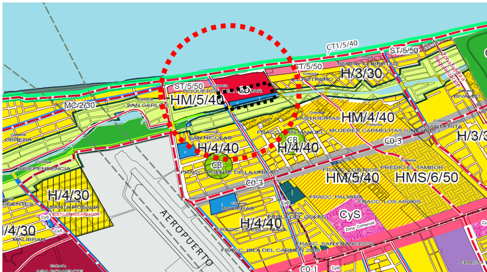
Croquis de ubicación.

La Dirección de Desarrollo Urbano presentó a esta Comisión dictaminadora, un dictamen técnico en donde evalúa la pertinencia de otorgar el cambio de uso de suelo al solicitante.