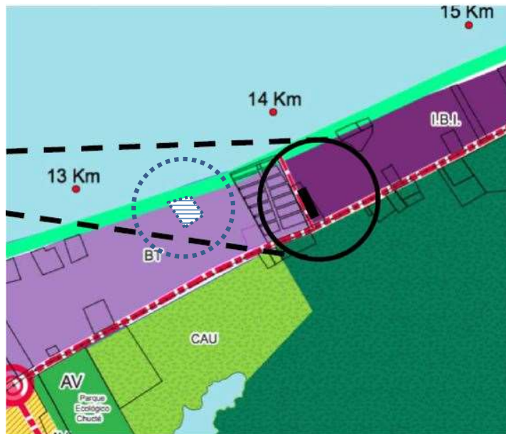
Croquis de ubicación.

El bien inmueble, materia del presente asunto, se identifica con la clave catastral 0400100309000000601600013000000 y número de cuenta predial U150455.