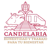
TABULADOR DE SUELDOS MENSUAL EJERCICIO FISCAL 2024 SISTEMA MUNICIPAL PARA EL DESARROLLO INTEGRAL DE LA FAMILIA DE CANDELARIA